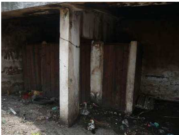
sanitaires et douches