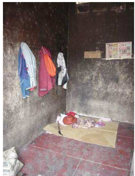
une des 8 chambres